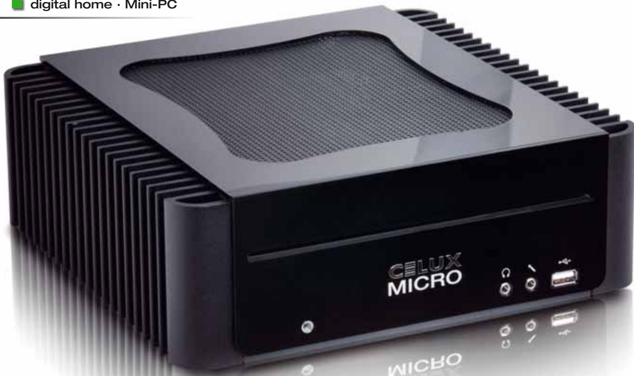
Lautloser PC für Wohnzimmer und Büro von Celux